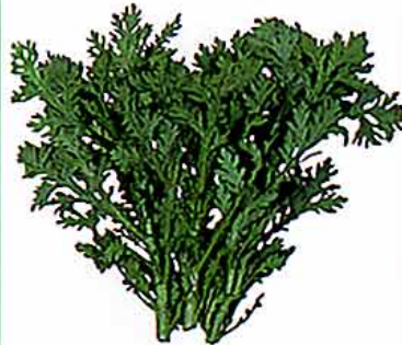
【キク科 garland chrysanthemum (英) /地中海沿岸地方原産】 ○おいしい時期：11～5月 ○特徴：カロテン、ビタミンB2、食物繊維などが豊富。また、カルシウム、鉄分、マグネシウムなどの微量ミネラルも豊富。