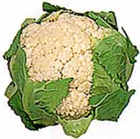
【アブラナ科 cauliflower (英) /地中海東部原産】 ○おいしい時期：11～3月 ○特徴：カリフラワーにはビタミンC、B1、B2が豊富。ブロッコリーはカリフラワーに比べ、ビタミンC、B群、カロテン、カリウム、鉄分などが豊富。