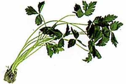
【セリ科 Japanese hornwort, mitsuba (英) /中近東地域原産】緑黄色野菜 ○おいしい時期：7～8月 ○特徴：独特の香りは、クリプトテネンという成分で、神経を鎮める作用がある。葉の部分にはビタミンAが豊富。