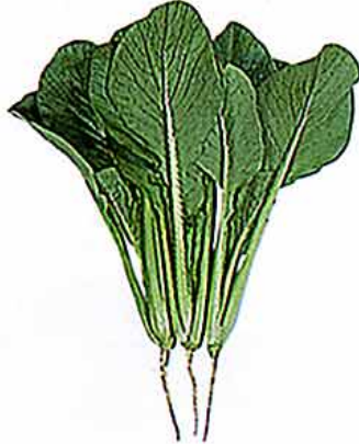
【アブラナ科(漬け菜) komatsuna (英) /中央アジア産】緑黄色野菜 ○おいしい時期：6～9月 ○特徴：日本人に不足しがちな栄養素であるカルシウムを多く含む。漬け物や煮物によく使われるアブラナ科の葉菜類を漬け菜(菘菜(すずな))とよび、そのひとつ。小松菜以外には、野沢菜、水菜、壬生菜(みぶな)大阪しろな、雪白体菜(たいさい)(杓子(しゃくし)菜)などがある。