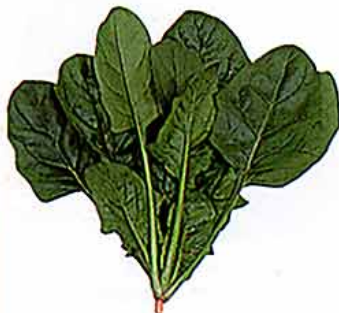
【アカザ科 spinach (英) /西アジア原産】 ○おいしい時期：11～1月 ○特徴：カロテン、鉄分、ビタミンC、マグネシウムや亜鉛、マンガンなどの微量元素を含んでいる。