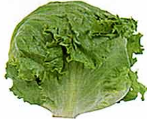
【キク科 head lettuce (英) /萵苣(日本名)】 ○おいしい時期：春から秋 ○特徴：全体の95.9%が水分だが、生で食べられるためビタミンCやカロテン、カリウム、鉄分、亜鉛などをそのまま吸収することができる。また、カルシウムや水溶性食物繊維も含まれる。レタスには鎮静作用があるといわれ、欧米では古くから薬用植物とされてきた。日本では、「萵苣」と呼ばれ10世紀には栽培されていた記録がある。