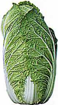
【アブラナ科 Chinese cabbage (英) /中国北東部原産】 ○おいしい時期：11～2月 ○特徴：利尿効果のあるカリウムとビタミンC、B1やマグネシウム、食物繊維が豊富。糖質が少ない分、キャベツより低カロリーとされる。