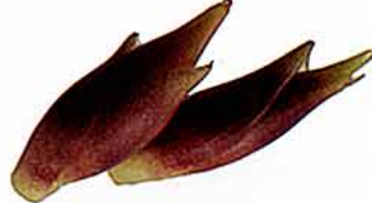
【ショウガ科 Japanese ginger (英) /日本原産】淡色野菜 ○おいしい時期：夏みょうが・7～8月、秋みょうが・9～10月 ○特徴：独特の香りは、アルファピネンという成分。香り成分と辛み成分とで、消化促進、食欲増進に役立つ。