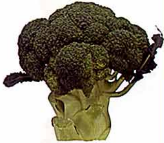
【アブラナ科 broccoli (英) /地中海東部原産】