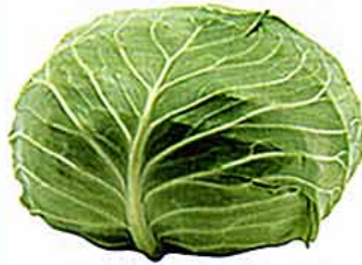
【アブラナ科 cabbage (英) /ヨーロッパ原産】 ○おいしい時期：春キャベツ(春玉)/3～5月、夏秋キャベツ/7～8月、冬キャベツ(寒玉)/1～3月 ○特徴：潰瘍に効果のあるビタミンUが豊富(生食で食べるとよい)。ビタミンCとカリウムは外側の葉と芯に多く含まれる。