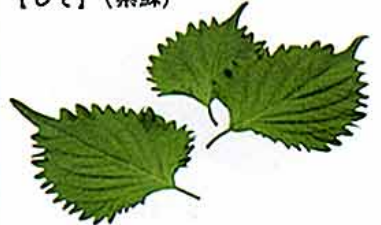
【シソ科 perilla leaves (英) /日本原産】 ○おいしい時期：青じそ・通年、赤じそ・6～7月 ○特徴：カロテンが豊富。カリウム、カルシウム、鉄分などのミネラルやビタミンB1、B2、Cも多く含まれる。しその香りの成分はペリラルデヒドという物質で、防腐・抗菌作用が高いとされている。