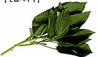
【シナノキ科 Jew's mallow (英) /中近東地域原産】緑黄色野菜 ○おいしい時期：7～8月 ○特徴：80年代に日本に入ってきた新しい野菜だが、ビタミン、ミネラル、食物繊維などに富み、栄養豊かなことから早くも食卓に定着。特にカルシウム、カロテンはほうれんそうの3倍近くも含み、野菜のなかでトップクラスの優秀さ。